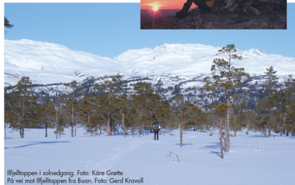
Ilfjelltoppen i solnedgang. På vei mot Ilfjelltoppen fra Buan.