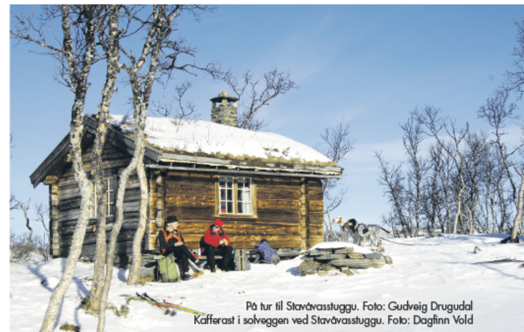
På tur til Stavåvasstuggu. Kafferast i solveggen ved Stavåvasstuggu.