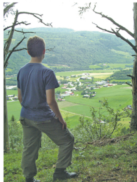
Vollagrenda sett fra Osphaugen.

som skal ha funnet sted for omtrent 1000 år siden. Der Pilegrimsleia møter Hurundsjøveien ser du to hauger. Sagn sier at dette er gamle gravhauger fra førkristen tid. Følg Hurundsjøveien ned til Rv 700 ved Voll og Rennebu hovedkirke.