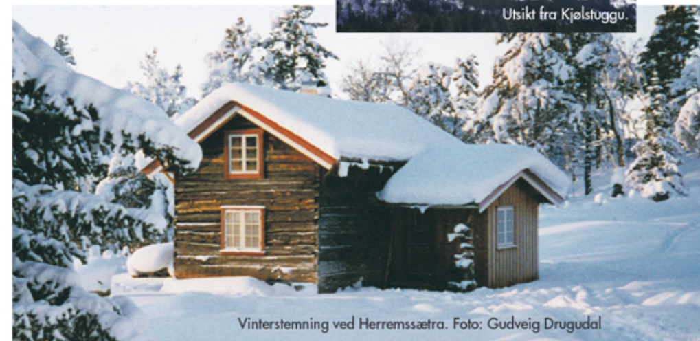
Vinterstemning ved Herremssætra.