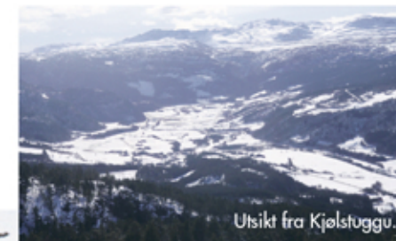
Utsikt fra Kjølstuggu.

Ved Reberg er det parkeringsmuligheter. Følg traktorveien fra prestegården til et stykke opp i bakken, ta til høyre og følg pilegrimsleia fram til du når Herremsgårdene. Du passerer en dødisgrop på høyre side. Den stammer fra siste istid, en gang for 15-20 000 år siden. Like ved dødisgropa tar pilegrimsleia av mot grenda, men du fortsetter videre etter stien til du møter traktorveien fra Herremsgrenda. Følg den til Herremssætra. Fortsett etter stien mot trimposten i Grajelan. Ta en liten pause mens du skriver navnet ditt i trimboka. Derfra følger du stien oppover mot Kjølstuggu, og du kan følge stien tilbake til Herremssætra.