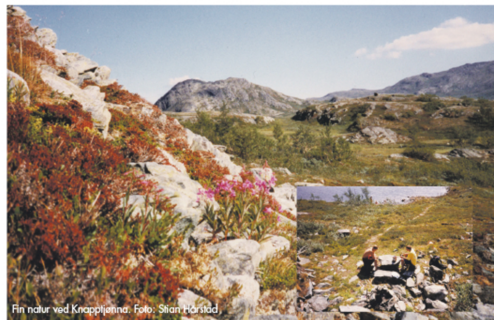
Fin natur ved Knapptjønna.

Målet er Knapptjønna ved Knapptjønna. Turen har lett stigning og du går på traktorvei et godt stykke innover, og etter hvert på sti. Stien går over bekker, opp berg og forbi ei dyregrav. Fra de siste høydene ser en utover hele Leverdalen, med Granasjøen og sætrene nede i dalen. Knapptjønna er bygd av stein, og utenfor er det steinbord og steinstoler der du kan sette deg og nyte medbrakt niste. Her er det ildsted og muligheter for kaffekoking og grilling. Turen er best egnet på sommers tid. Dette er en tur som er godt egnet for barn.