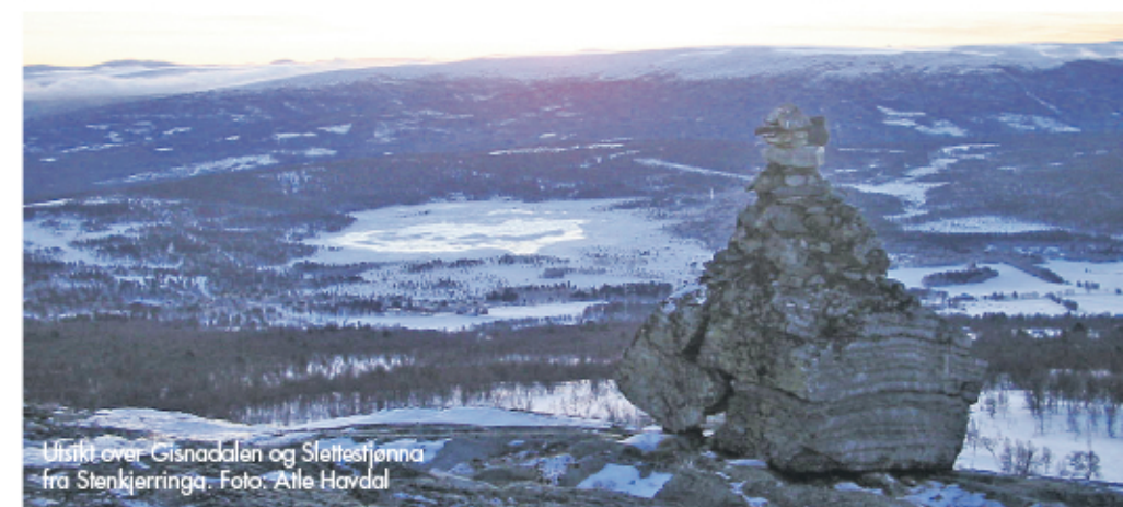
Utsikt over Gisnadalen og Slættstjøna fra Stenkjerringa.

Du kan returnere samme vei som du kom, men halvveis gjennom Falkhøskaret anbefaler vi å legge turen om Stenkjerringa før du går ned til Nylendsætra igjen. Dette er en artig steinformasjon som er verdt et syn. Tilbake på parkeringsplassen vet at vi du vil tenke at du har hatt en fabelaktig fin tur!