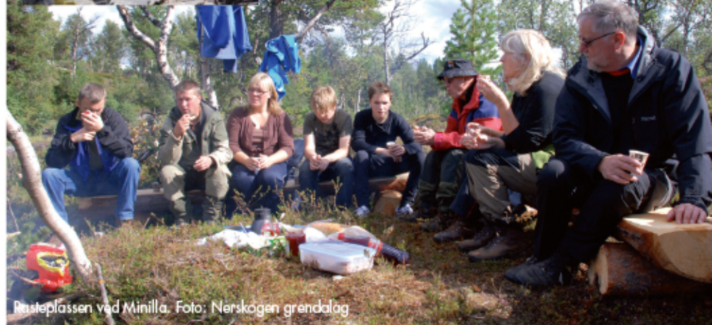
Rasteplassen ved Minilla.