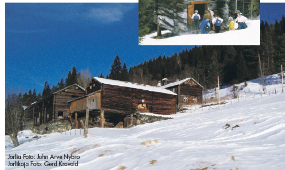
Jorlia Jorlikoja