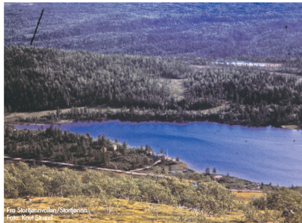
Fra Stortjønnvollen/Stortjønn.

Ved Tysksætra er det mulighet for å parkere, men også for å kjøre videre mot Innerdalen eller Stortjønnvollen. På sykkel er det fint og ta en rundtur om Stortjønnvollen til Bustaden, der det finnes flere godt synlige dyregraver. Fra Bustaden tilbake mot Tysksætra følges Innerdalsveien, eventuelt kan en forlenge turen innover mot demningen og videre mot Kvikne.